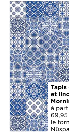
Tapis en vinyle et linoléum Morning, à partir de 69,95 $ selon le format, Nüspace

À MARIER AVEC... le blanc, le doré et les bois aux tons chauds de caramel.