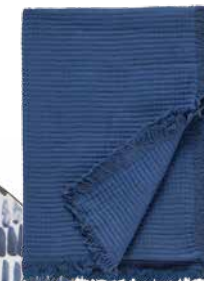
Couverture en coton Waffle, 51 po x 71 po, 129 $, BoConcept