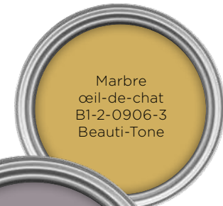
Marbre œil-de-chat B1-2-0906-3 Beauti-Tone