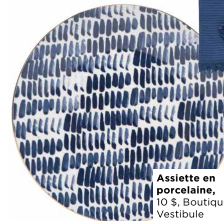
Assiette en porcelaine, 10 $, Boutique Vestibule