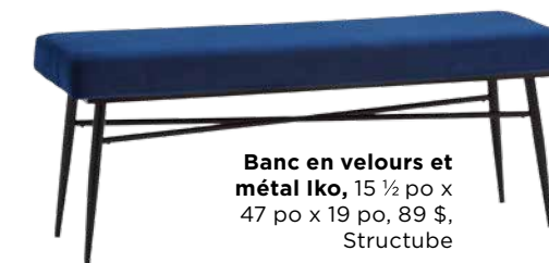
Banc en velours et métal Iko, 15 1/2 po x 47 po x 19 po, 89 $, Structube