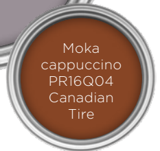
Moka cappuccino PR16Q04 Canadian Tire