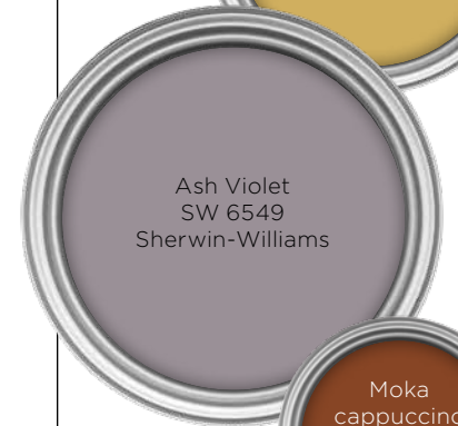
Ash Violet SW 6549 Sherwin-Williams