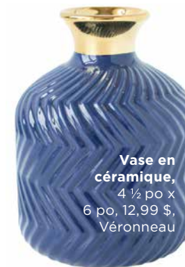
Vase en céramique, 4 1/2 po x 6 po, 12,99 $, Véronneau