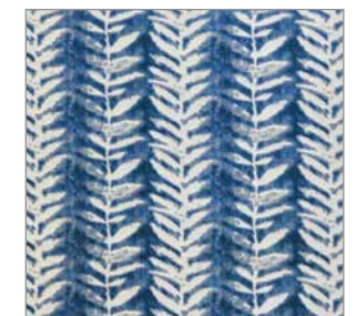
Tissu en polyester Orion bleu, collection Chic bohémien, 34,99 $ le mètre, Fabricville