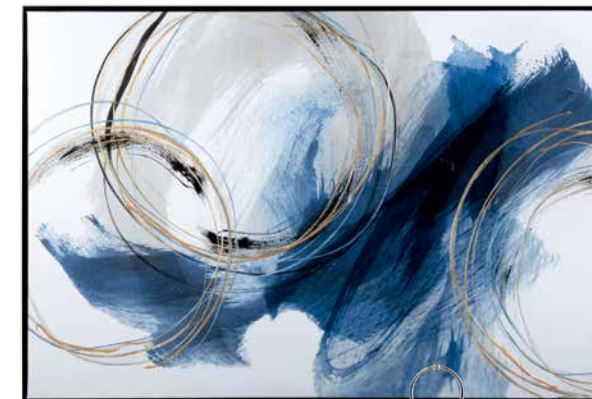
Tableau abstrait embelli au gel, 30 po x 45 po, 169,99 $, Bouclair