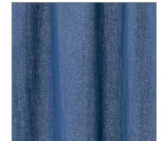
Rideau en lin, 48 po x 98 po, 109 $ les 2 panneaux, H&M Home