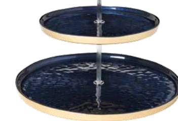
Plateau à deux étages en métal peint, 14,99 $, HomeSense