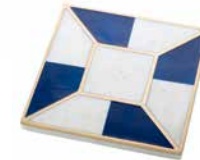
Sous-plat en marbre, laiton et résine Parasol, 7 po x 7 po, 52,95 $, cb2.ca

À MARIER AVEC... le blanc, le doré et les bois aux tons chauds de caramel.